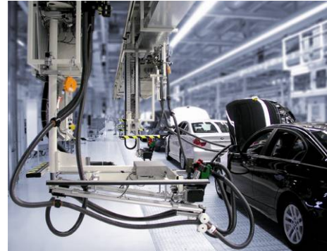
Abb.: Kombibefüllanlage bei BMW in Leipzig

Kernkompetenz von Dürr Somac ist, Fahrzeugsysteme entsprechend der Anforderungen der Kunden an Prozess und Taktzeit unter Produktionsbedingungen zu testen und zu befüllen. Die Anlagentechnik gewährleistet ein Höchstmaß an Qualität und Zuverlässigkeit unter Beachtung der gesetzlichen Auflagen des Gesundheits- und Umweltschutzes.