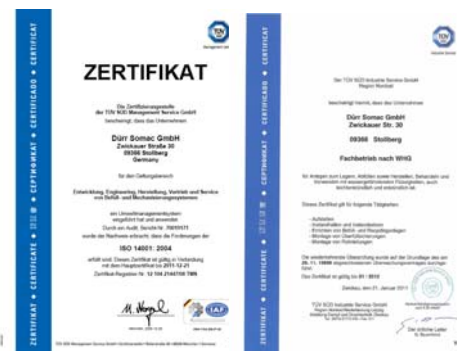
Abb.: Energie Label und zertifiziertes Umweltmanagement